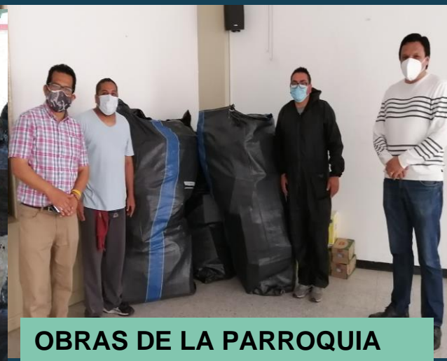
OBRAS DE LA PARROQUIA