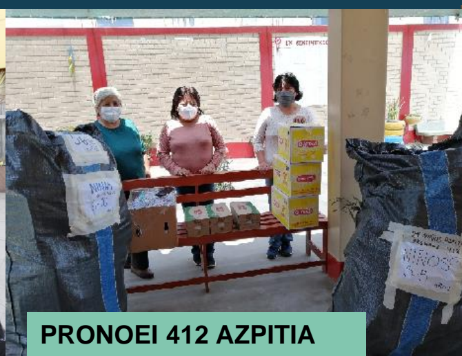
PRONOEI 412 AZPITIA