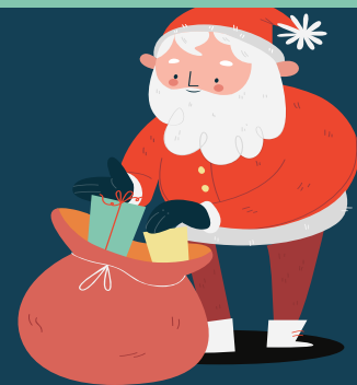
P. BRAÍN - BREÑA