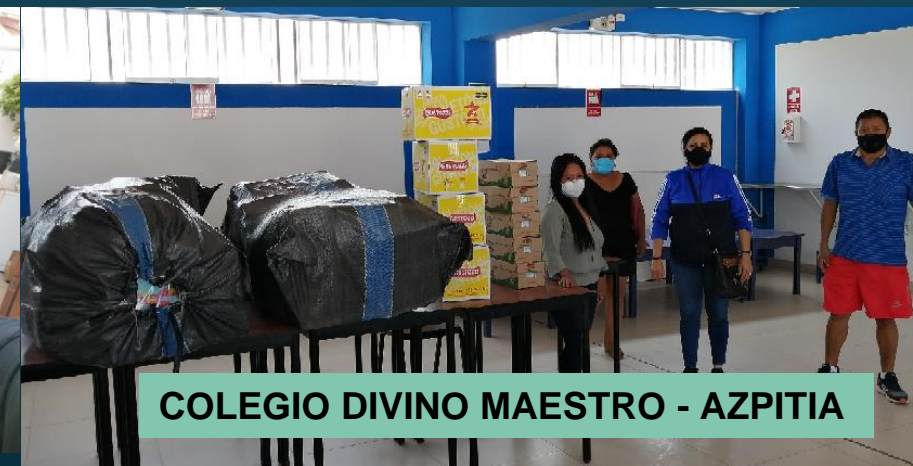
COLEGIO DIVINO MAESTRO - AZPITIA