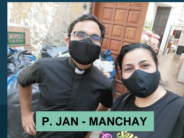
MANCHAY